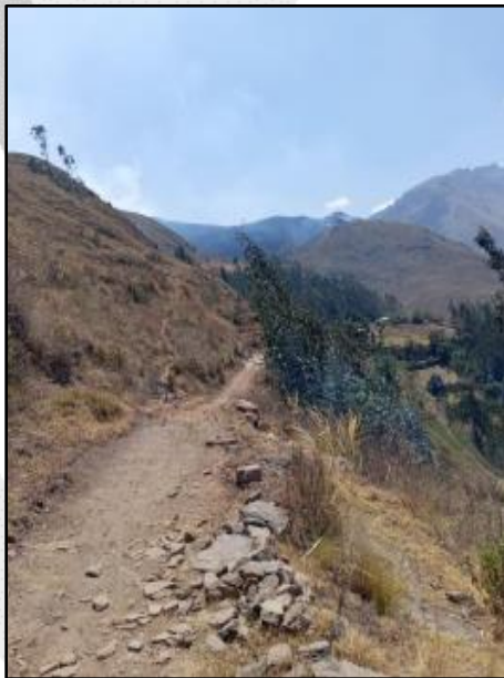
Incendio forestal en el caserío de Puyalli, distrito de Pampas