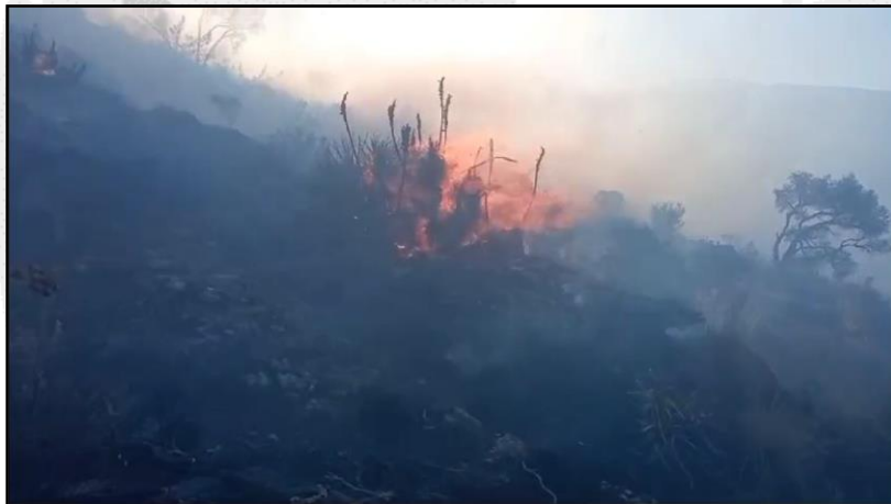
Incendio forestal en el distrito de Shilla