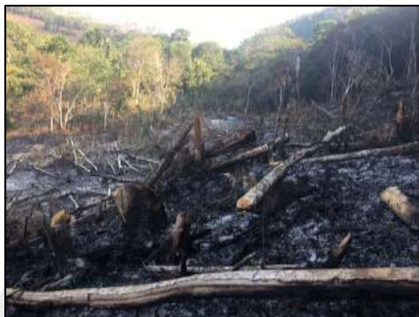
Incendio forestal en el distrito de Jepelacio