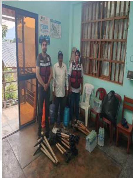
Entrega de herramientas para los trabajos de extinción del incendio