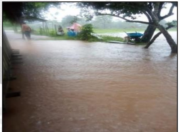
Inundación por desborde de río en el distrito de Balsapuerto

Distribución: A los tres niveles de Gobierno (Nacional, Regional y Local).