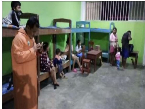
Personas damnificadas pernoctan en el coliseo cerrado del (IPD)