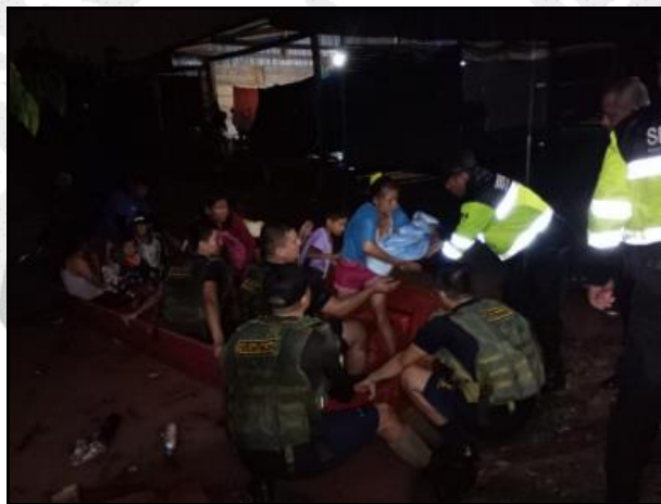
Personal de la Marina de Guerra y Serenazgo de la municipalidad en apoyo a la evacuación de la población