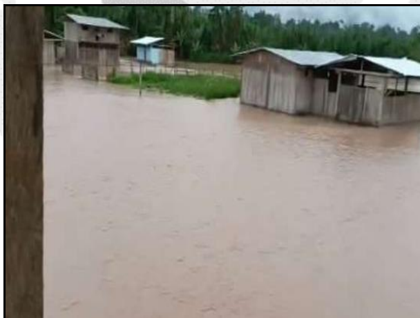
Inundación en el distrito de Pampa Hermosa