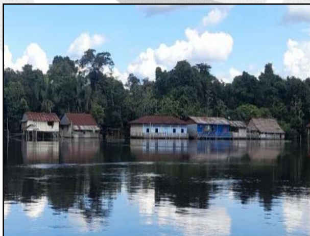
Inundación en el distrito de Alto Nanay