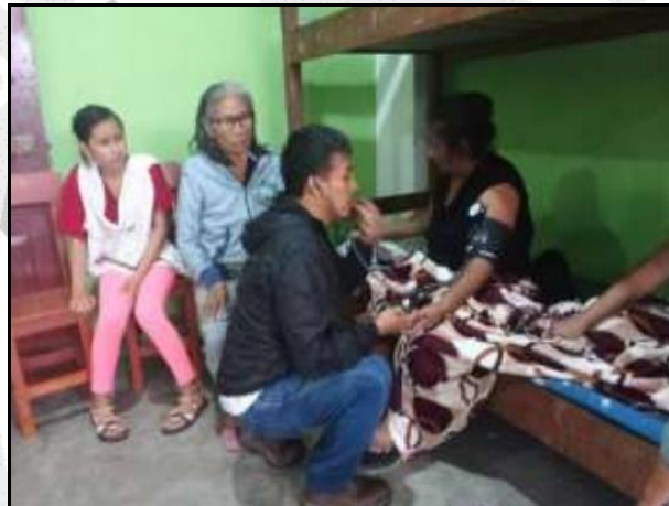
Atención a las personas damnificadas por parte de la Gerencia Regional de Salud