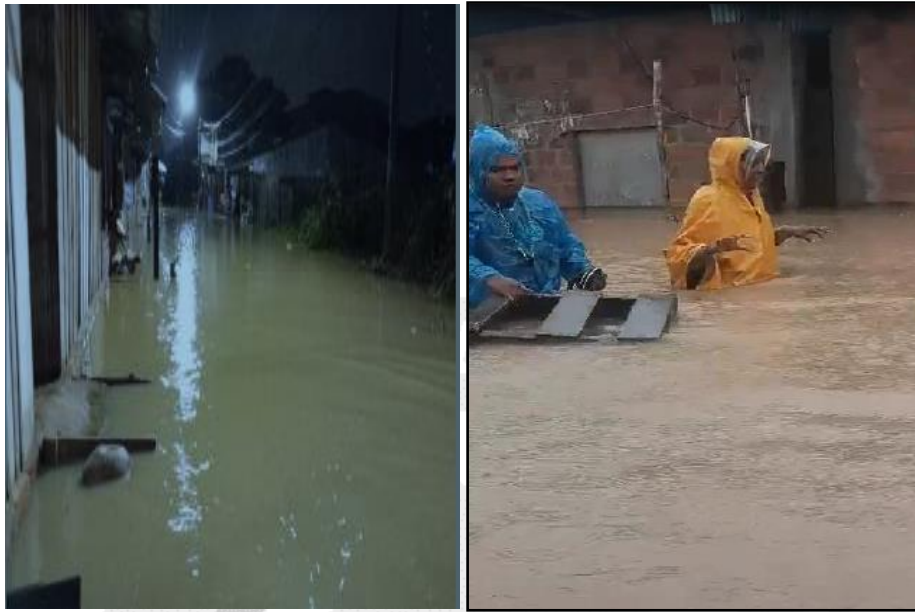
Inundación en el distrito de Yurimaguas