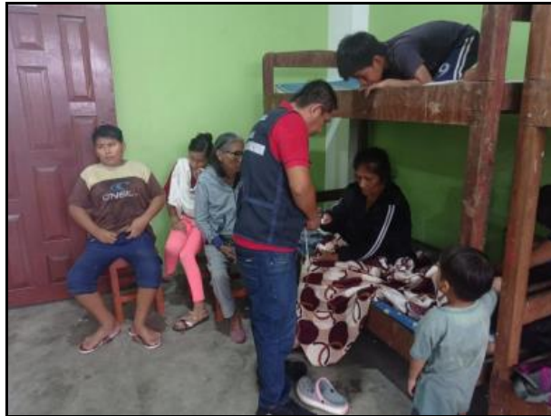
Personal de la Red de Salud Alto Amazonas brindó atención a la población afectada