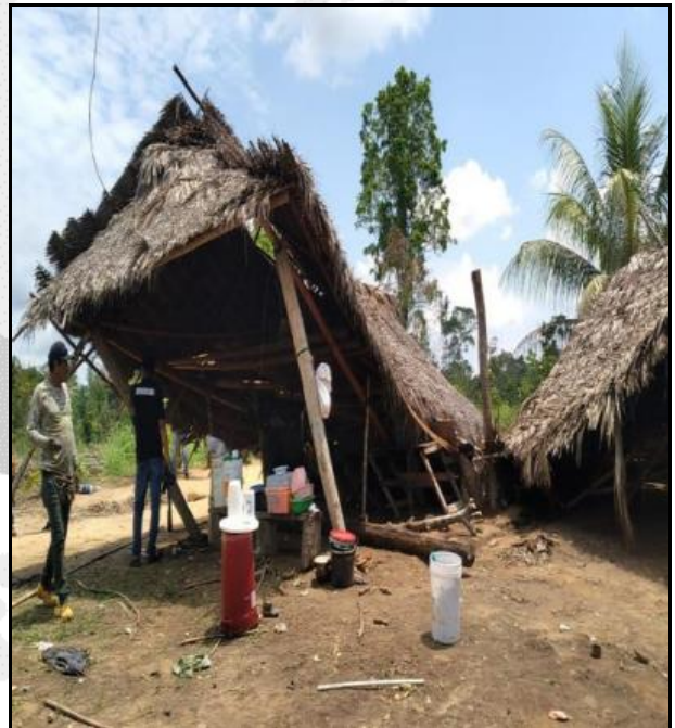
Afectación causada por los temporales