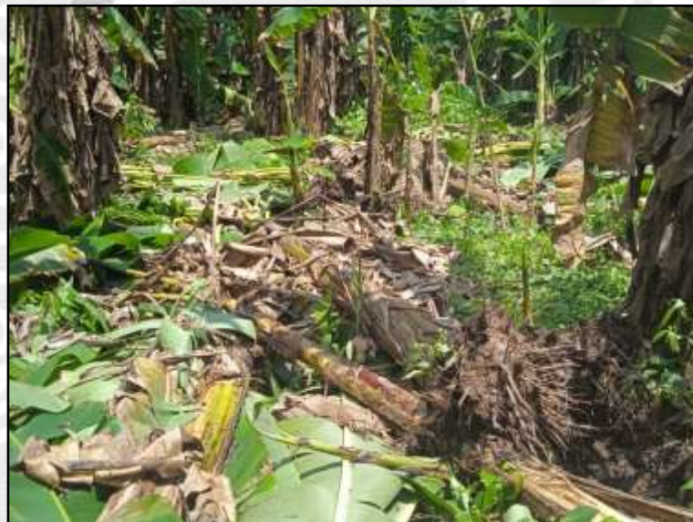
Afectación causada por los vientos fuertes