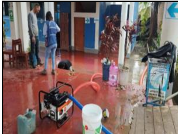
Lluvias intensas afectan Institución Educativa en el distrito de Pichari