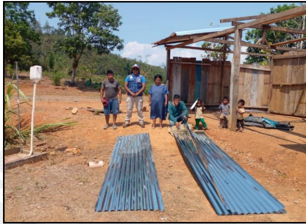
Entrega de Bienes de Ayuda Humanitaria a las personas afectadas