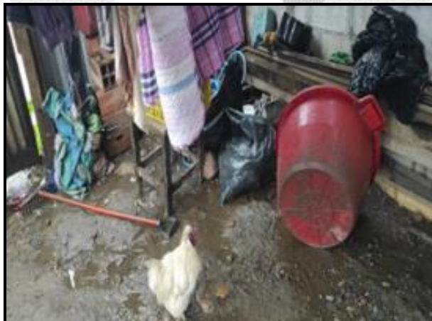
Lluvias intensas afectan viviendas en el distrito de Pichari