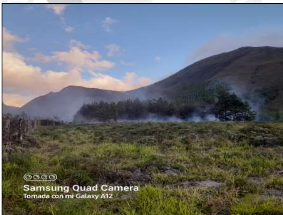
Afectación causada por el incendio forestal