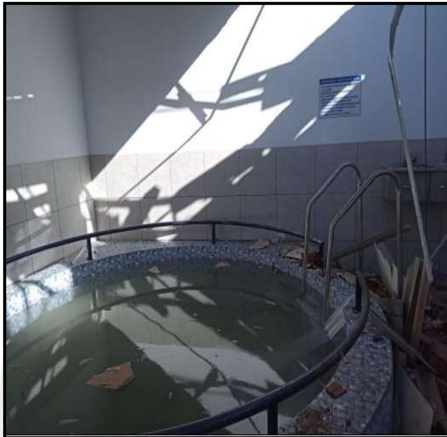
Explosión en una sauna en el distrito de Caraz