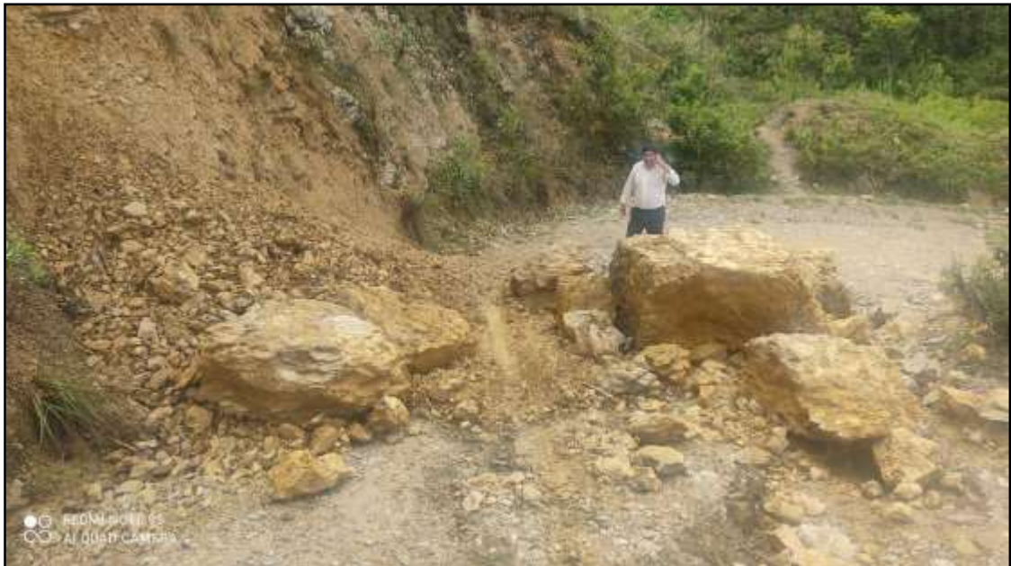
Lluvias intensas en el distrito de Chimban