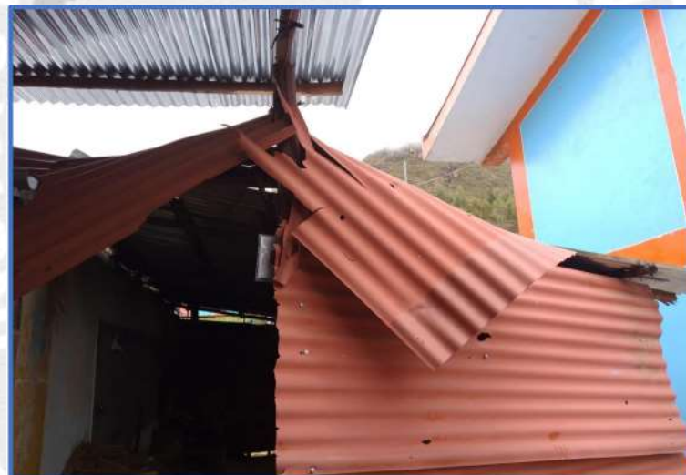
Afectación causada por los temporales