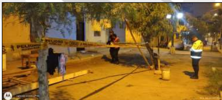
Derrumbe de vivienda en el Distrito de Ate Vitarte