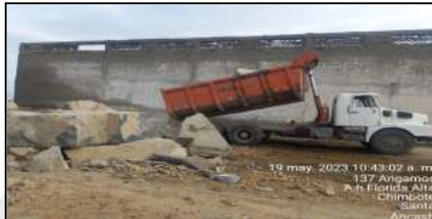
Trabajos de enrocado en el litoral.