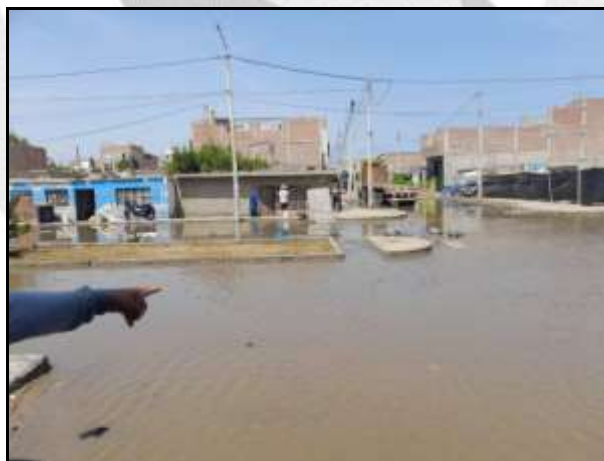
Oleajes anómalos en el AH. La Florida – distrito de Chimbote