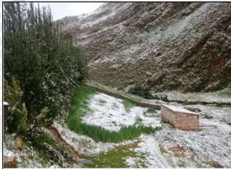
Personas y cultivos afectados por las granizadas