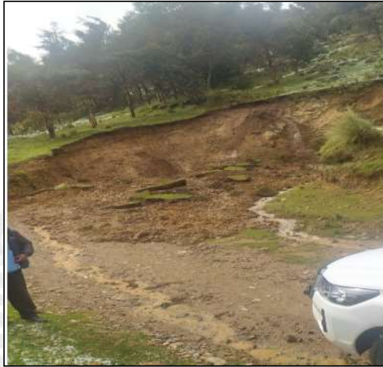
Deslizamiento en el distrito de Velille