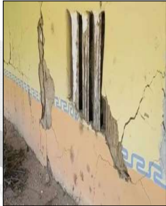
Afectaciones en las viviendas por el sismo