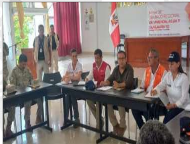
Ministra del MVCS, MINDEF y PREMIER en reunión de coordinación con el Gobernador Regional de Tumbes