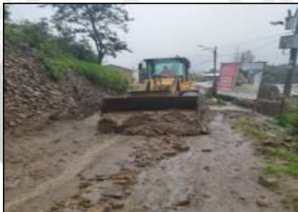
Trabajos de limpieza y rehabilitación de las vías afectadas