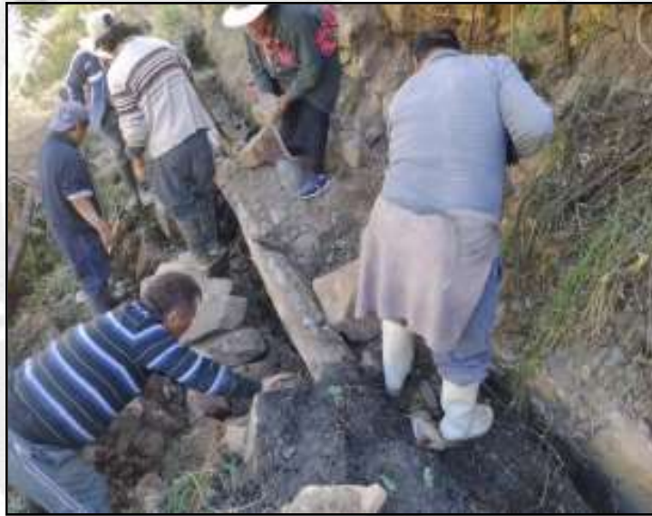
Limpieza de los canales de regadío