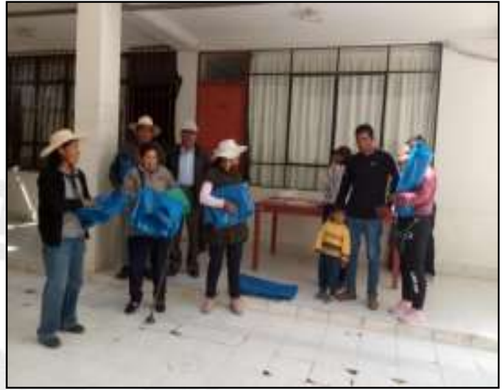
Entrega de Bienes de Ayuda Humanitaria