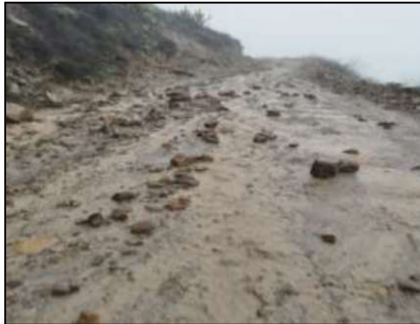
Camino rural afectado por lluvias intensas