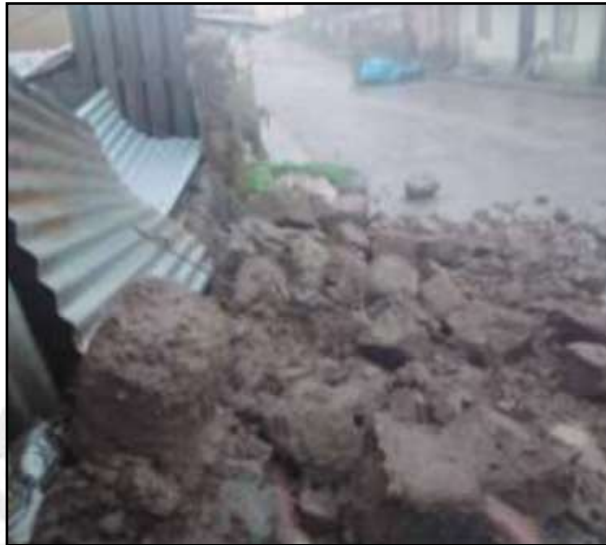
Viviendas afectadas en el distrito de Puquina