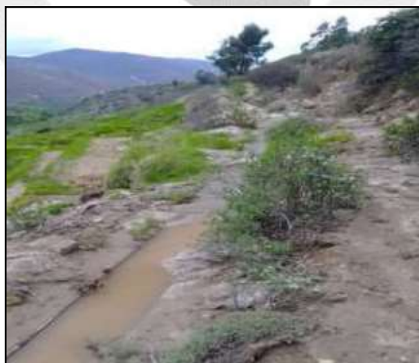
Canal de riego afectado