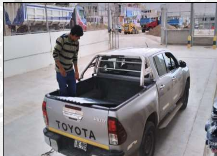
Entrega de Bienes de Ayuda Humanitaria