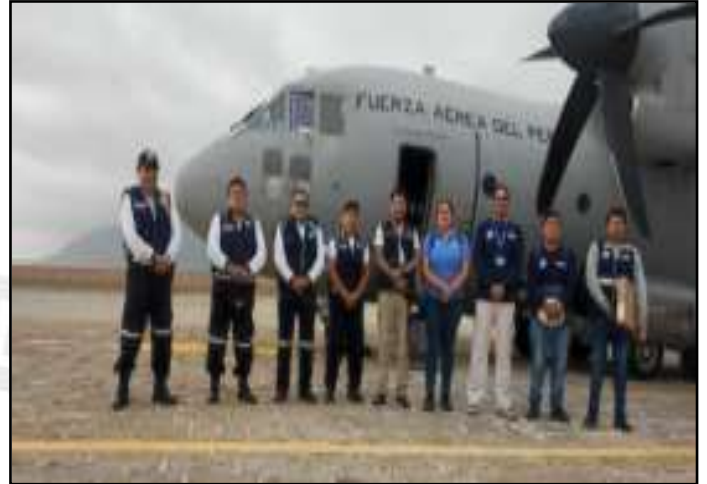
Arribo de equipo DIGERD a la ciudad de Arequipa, distrito de Arequipa