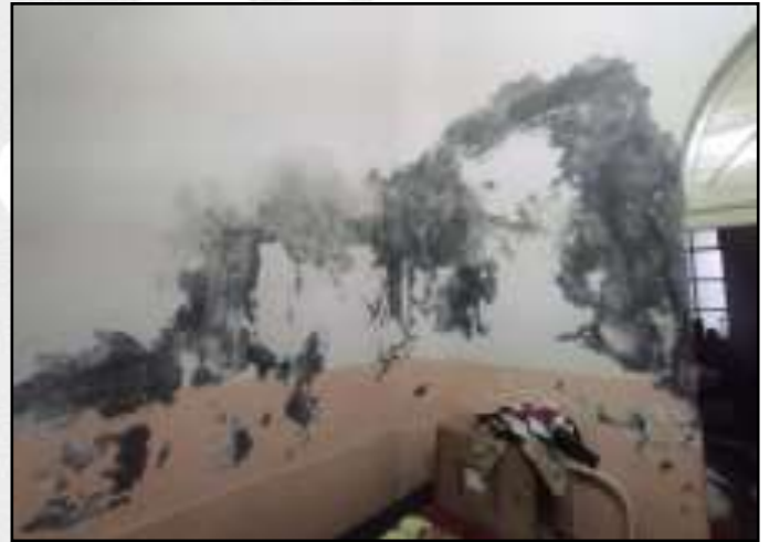
Afectación en el Hospital Goyoneche, distrito de Arequipa