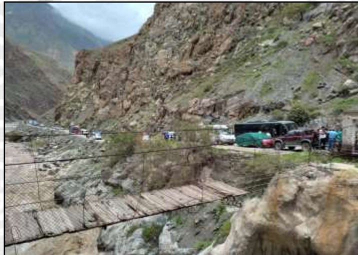
Daños registrados en el distrito de Choco