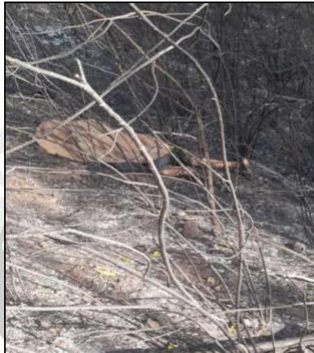
Daños causados por el incendio forestal.