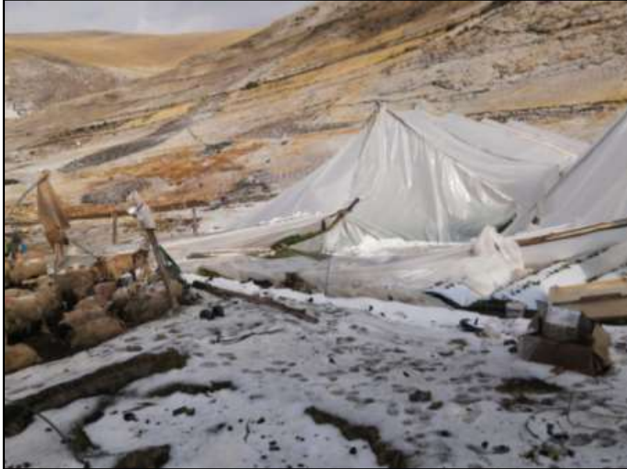
Afectación producto de la granizada en el distrito de Mara.