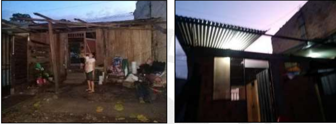
Viviendas afectadas por temporales