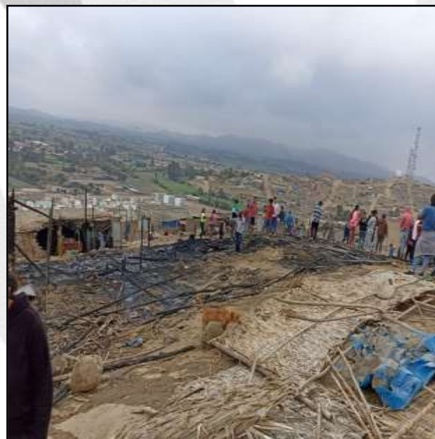
Incendio urbano en el distrito de Supe Puerto