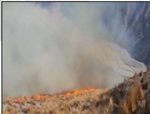
Incendio forestal en el sector Quelloquello, distrito de Huaquirca