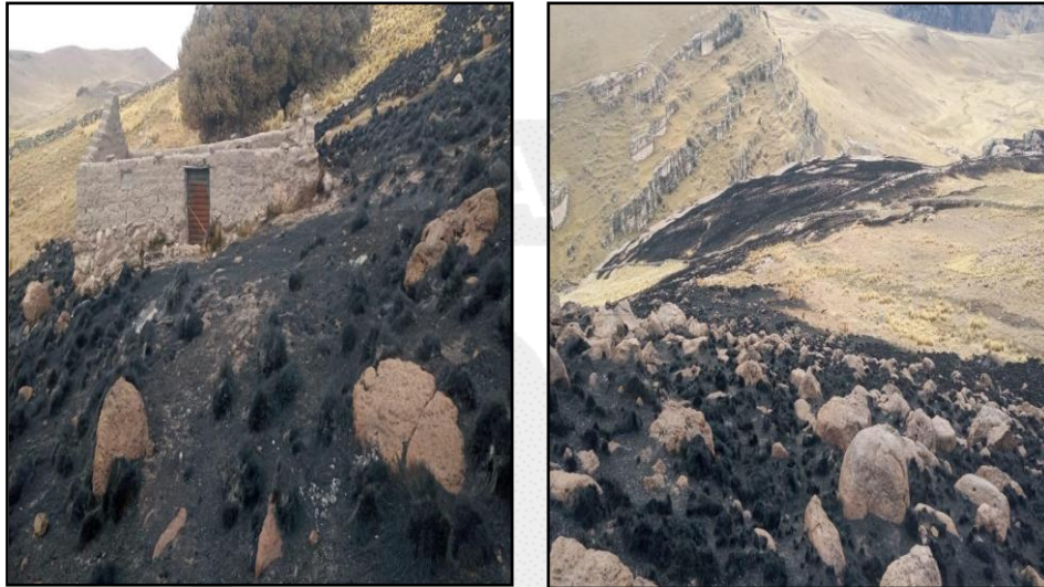
Incendio forestal en el distrito de Palca