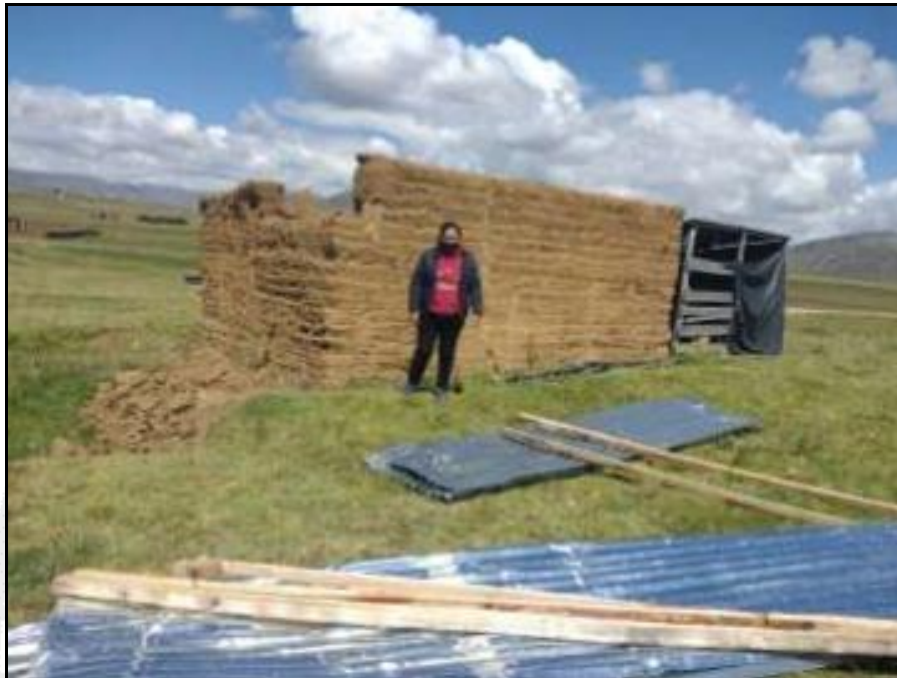
Vientos fuertes afectan viviendas en el distrito de La Unión.