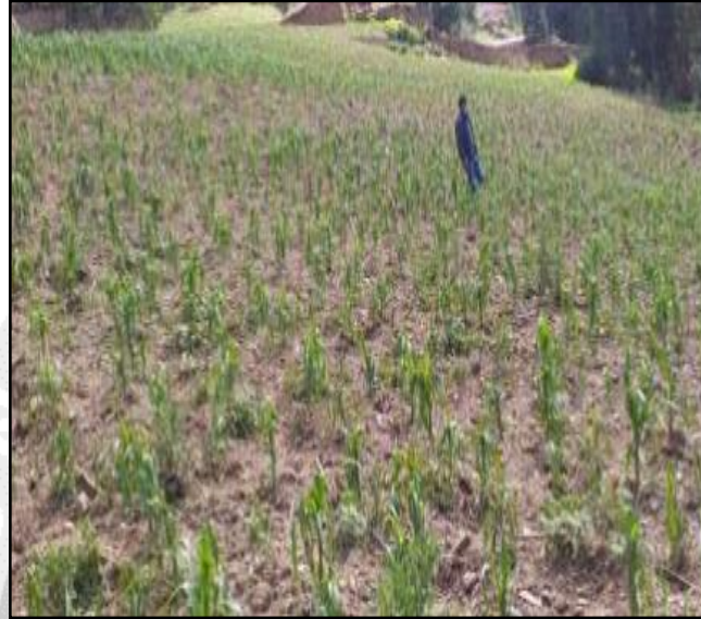
Afectación producto de la granizada en el distrito de Huacaybamba.