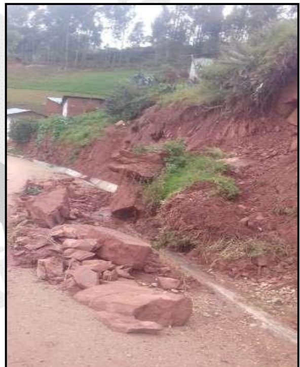
Deslizamiento en el distrito de Quivilla - Huánuco