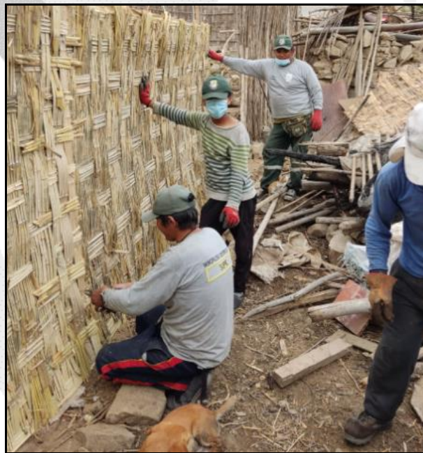
Entrega de material provisional para damnificados por incendio urbano