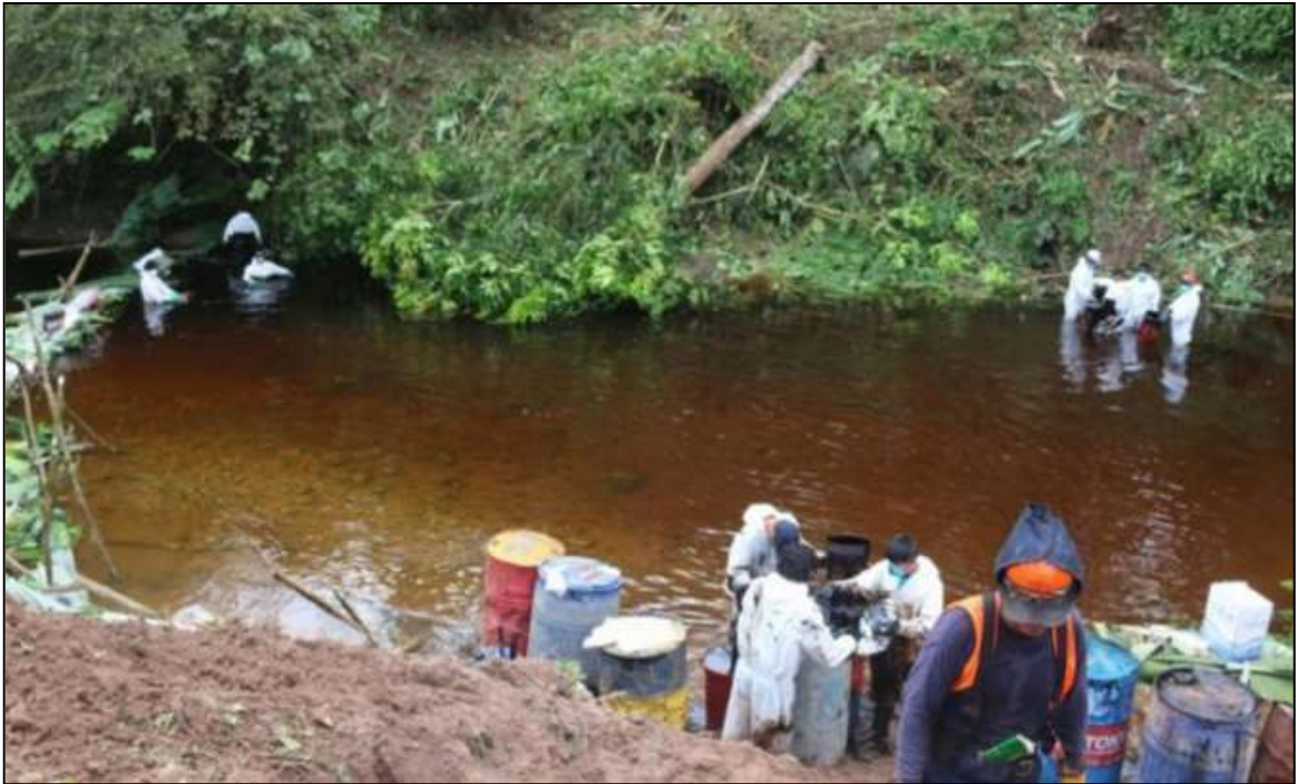
Afectación de las aguas de la quebrada Uchichiangos.