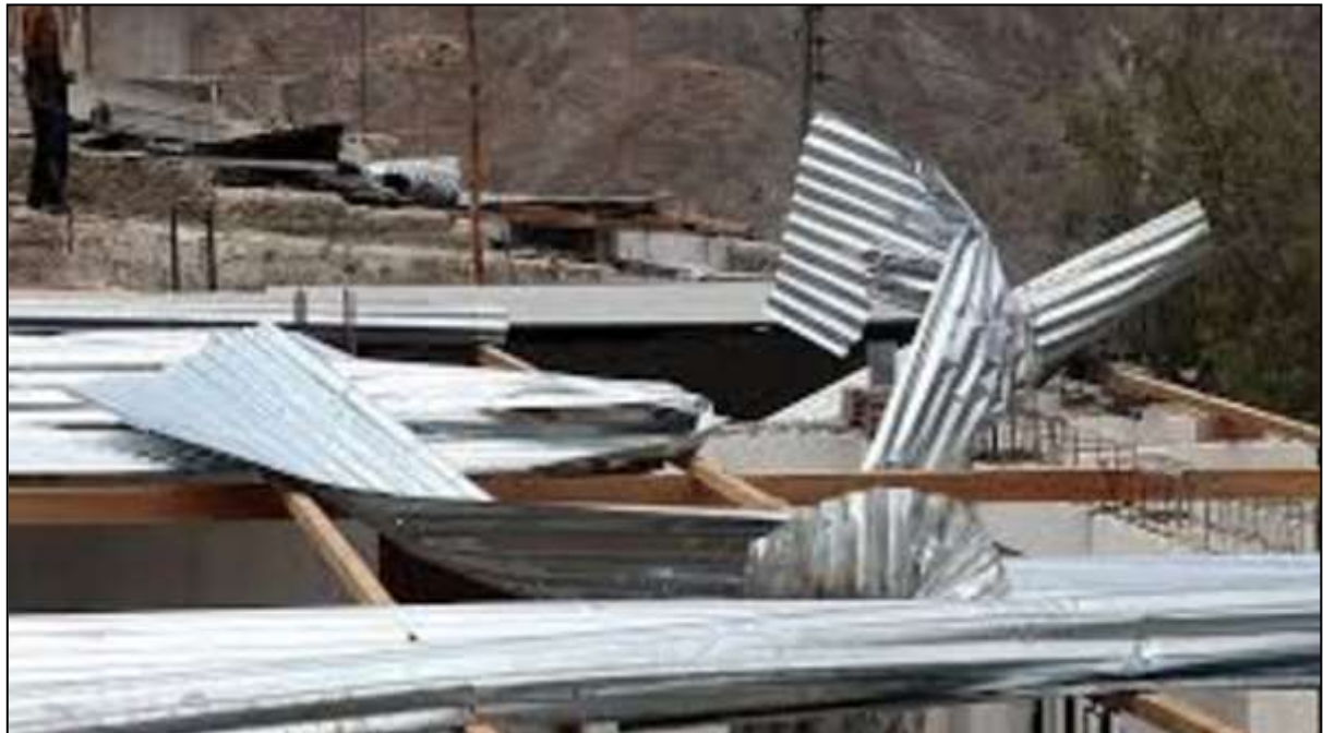
Voladura de los techos de calaminas