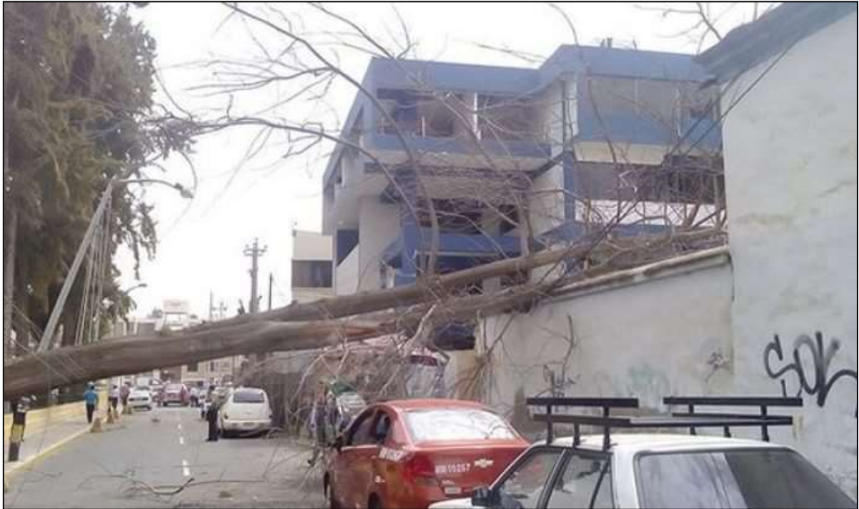
Caída de árboles sobre las vías de comunicación.