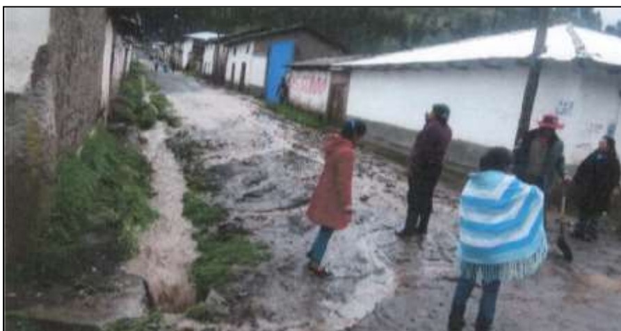
Inundación de calles