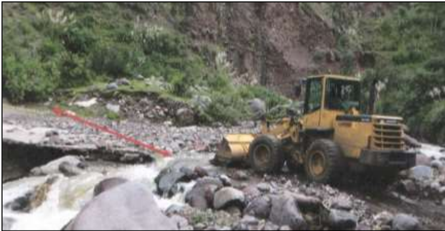
Maquinaria pesada trabajando en zona afectada