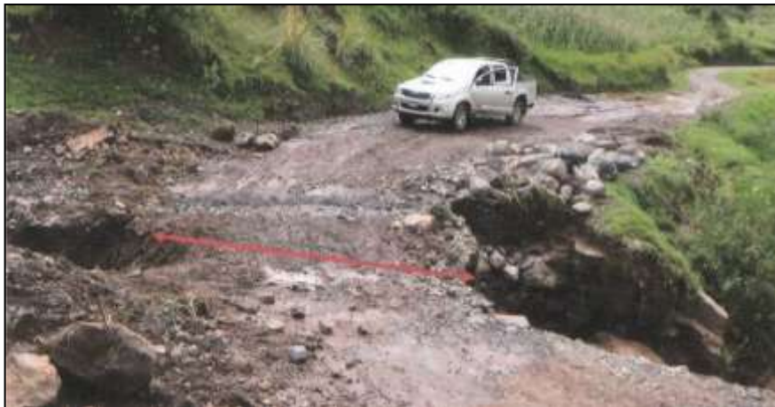
Pase a vehículos menores