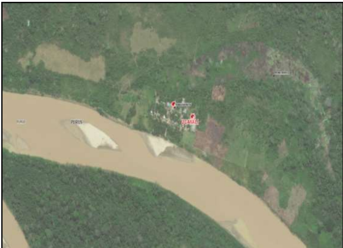
Mapa de ubicación de población vulnerable